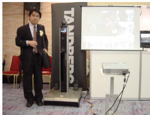
TANDBERG ブース (Maestro と記念撮影の編集長)

その他では、JENS Web コラボレーションサービス (WebArrow)、ゼッタテクノロジーの SmoothCom などが展示されていた。