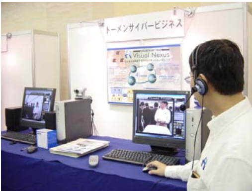
トーマンサイバービジネス