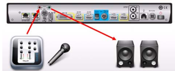
アナログオーディオにも対応（ラドビジョンジャパン資料）

その他、今回 Piccolo の発売にあわせて、SCOPIA XT 1000 シリーズ全機種において、デジタルに加えアナログオーディオにも対応した。