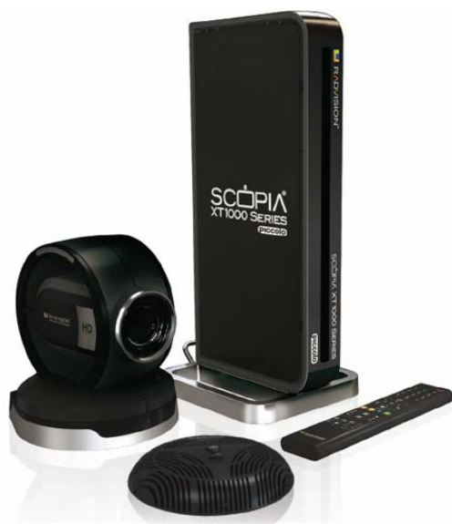
SCOPIA XT 1000 Piccolo: XT1000シリーズの本体デザインを踏襲

ラドビジョンジャパン株式会社（東京都台東区）は、HD 対応ビデオ会議システムの新製品「SCOPIA XT 1000 Piccolo（ピッコロ）」を発表。（8月23日）