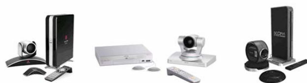
「POLYCOM HDX8000」、「SONY PCS-XG80」、「RADVISION SCOPIA XT1000」

比較デモンストレーションでは、要望の多い「Polycom HDX シリーズ」、「SONY PCS-XG シリーズ」、「RADVISION XT 1000 シリーズ」の3つのメーカーのテレビ会議端末をデモルームに常時設置。映像・音声および操作感を比較出来る環境を整えた。同機種同士の対向での接続、及び異機種同士の接続、MCU デモも可能。上記製品以外での比較を希望の場合は別途問い合わせ要。