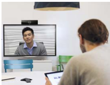
Debutの利用イメージ（ポリコムジャパン）

Polycom RealPresence Debut は、小規模なワークスペースでの使用に適したシンプルで洗練されたデザインのビデオ会議システム。フル HD 1080p に対応しているほか、会話以外のバックグラウンドノイズを低減する「Polycom NoiseBlock」技術、不安定なネットワーク環境でも鮮明かつ途切れないビデオ会議を実現する