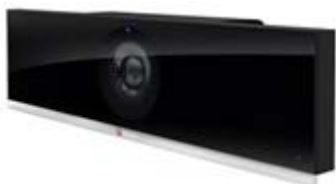
Polycom RealPresence Debut（ポリコムジャパン）

ポリコムジャパン株式会社 ( http://www.polycom.co.jp/ )（東京都新宿区）は、小規模なワークスペースでの使用に適した「Polycom RealPresence Debut」、タッチスクリーンデバイス「Polycom RealPresence Touch」、中規模会議室向けテレプレゼンスソリューション「Polycom RealPresence OTX Sutudio」の3製品の日本市場向けの販売を2月2日より開始する。