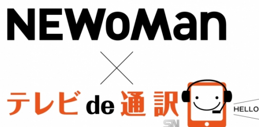
NEWoMAN で採用されたテレビ de 通訳 (スマート・ナビ)

株式会社スマート・ナビ ( http://www.smartnavi.co.jp/ ) (東京都豊島区) が展開する「テレビ de 通訳」を、JR 新宿駅新南エリアに開業した「NEWoMan (ニューマン)」 ( https://www.newoman.jp/ ) が一斉導入し、約 100 店舗での運用が始まったと発表。大型商業施設全館にビデオ通訳が配備されるのは日本初とのこと。