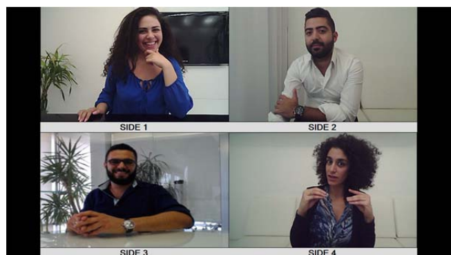
4 画面分割 (SilexPro)

ディスプレイ（17.5 インチ）はタッチパネル、スピーカーフォンにはゼンハイザー製を採用、HD カメラ（それぞれの側面に内蔵）、HDMI や LAN 端子などを装備している。