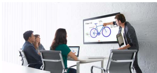
Cisco Spark Board (シスコシステムズ)

シスコシステムズ社 ( http://www.cisco.com/ ) (米国・カリフォルニア州) は、最新のクラウドやデバイス技術などを使い会議の生産性を向上させる、オールインワンのクラウド型会議用製品「Cisco Spark Board」と「Cisco Spark Meetings」を発表した。