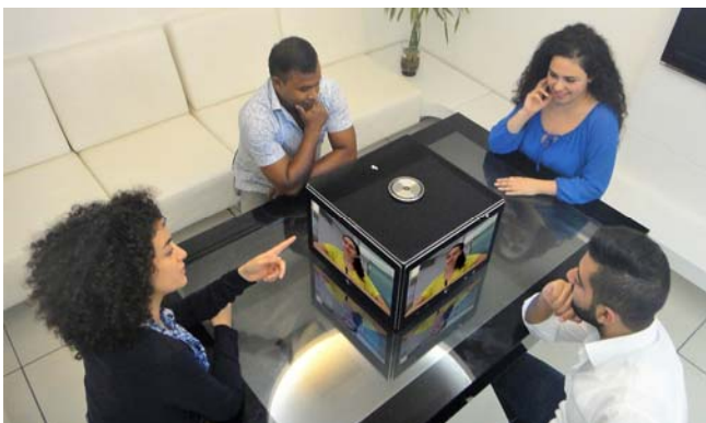
Sillex PTE Quattro (SilexPro)

SilexPro 社 ( http://www.sillexpro.com/ ) は、ビデオ会議に“センター・オブ・テーブル”というコンセプトを新たに取り入れ、ビデオ会議のユーザエクスペリエンス向上にフォーカスしたソリューション「Silex PTE」シリーズを北米や EMEA、APAC (一部) において展開している。ビデオ会議にとどまらず通常の会議でも利用できる製品。