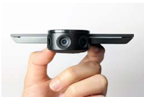
Altia Systems 社製 PanaCast 3(NEC ネットエスアイ)

NEC ネットエスアイ株式会社 ( https://www.nesic.co.jp/ ) (東京都文京区) は、Altia Systems 社 (米国・カリフォルニア州) が提供するインテリジェント パノラマカメラ「PanaCast 3」の国内独占販売権を取得し、1月10日から国内販売を開始する。価格はオープン価格。