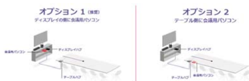
配線方法 (ロジクール)

「テーブルハブ」と呼ばれるテーブル上に置くハブには、USB と HDMI を使用して、パソコンと「マイクポッド」を接続する。これらの音声、映像、パソコンの信号がテーブルハブでひとつの信号にまとめられ、1本のCAT6a ケーブルで「ディスプレイハブ」に送られる。そして、モニター等の近くに設置した「ディスプレイハブ」をモニター、スピーカー、カメラに接続する。