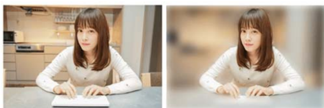
「AI 背景ぼかし」機能：適用前

PerfectCam 2 は、Web カメラ映像をソースビデオとしてサポートするビデオ会議アプリ、およびライブ配信プラットフォーム（Twitch、YoutubeLive、FacebookLive など）のプラグインとして機能し、「背景ぼかし」と「バーチャルメイク」を使用することができる。また、PerfectCam のホーム画面から、サイバーリンクの「U ビジネスコミュニケーションサービス」のほか、「Skype for Business」「Google Hangouts」など一般的なビデオ会議アプリを起動することもできる。