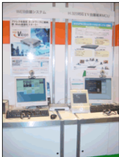
丸紅テレコムブースで

は、トーマンサイバービジネスの「Visual Nexus 3.0」、アー ルネットコミュニケーションのMCU「ビジュアルコミュニケー ションボックス」、韓国 CXP 社開発のウェブ会議システム 「Globiz21」、「WebVicon」を展示。