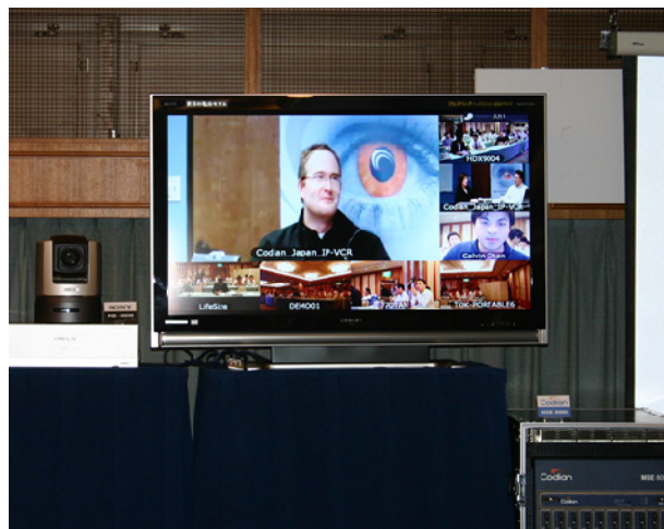
HD テレビ会議端末 + SD テレビ会議端末混在多地点接続

CMP は基本的にはシステム管理者が使用運用することを想定して開発されたシステムであるため、メディアプラスでは、多地点の会議をエンドユーザが簡単な PC 操作でその場で即座に開始できるシステムも組合せて提供。ユーザは会議を行う参加者を PC 画面でクリック選択し、会議開始ボタンをクリックすると自動で参加者端末をコール会議へ接続させる仕組み。