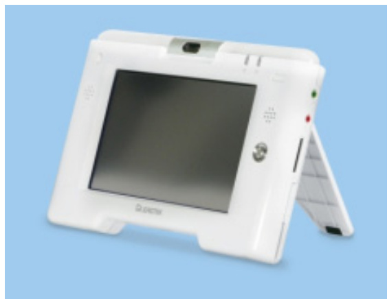
H.264 ビデオフォン LR8A10(リードテックジャパン資料)

「アメリカでは、IP コミュニケーションサービスや聴覚障害者向けサービスで数万台を出荷している実績がある。」(リードテックジャパン)