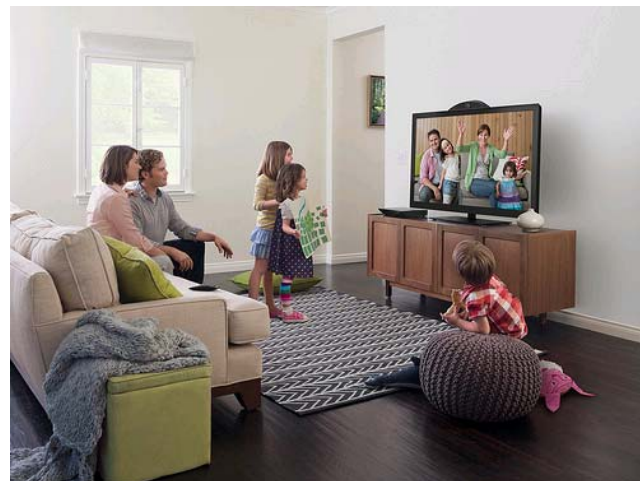
Cisco Umi 使用イメージ

ては、パン、チルト、ズームに対応し、プライバシー用のシャッターも付いている。これらは手動ではなく、駆動式となっている。