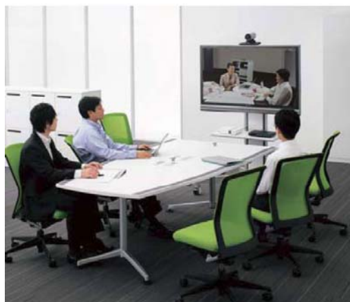
テレプレゼンス会議サービス 利用イメージ

TKP と NEC は、テレプレゼンス会議サービスを、東京大手町と大阪梅田の2ヶ所のTKP拠点で、10月15日から開始。