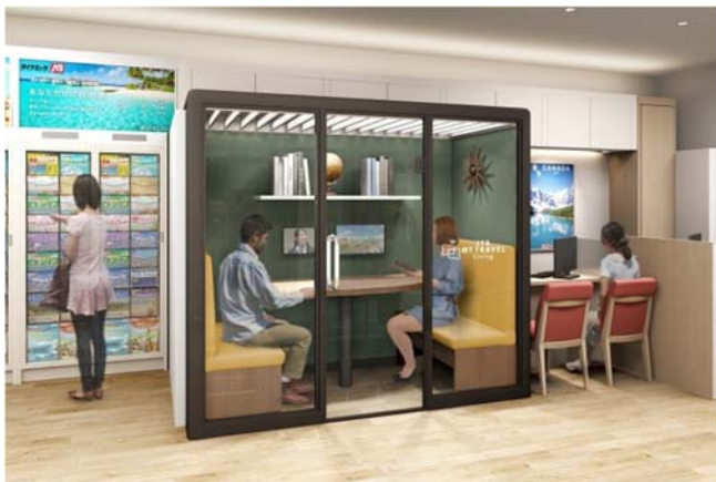
遠隔接客サービス MY TRAVEL Remote Box (JTB)

株式会社 JTB ( https://www.jtbcorp.jp/jp/ ) (東京都品川区) は、5月7日より、リモート接客空間「MY TRAVEL Remote Box」をトラベルゲート新宿店内にオープンする。