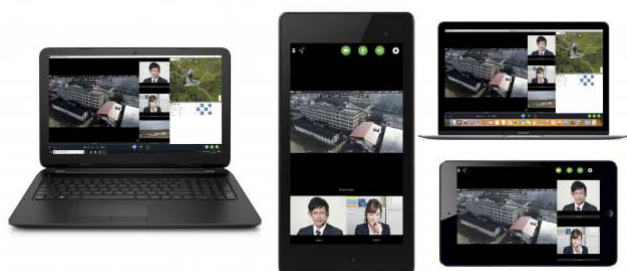
SENSYN DC 利用イメージ (センシンロボティクス)

株式会社株式会社センシンロボティクス ( https://www.sensyn-robotics.com/ ) (東京都渋谷区) は、ドローンを使ったリアルタイム映像共有サービス「SENSYN DC(センシン ドローンコミュニケーションサービス)」のiOS/Android/Mac OS アプリの提供を開始した。