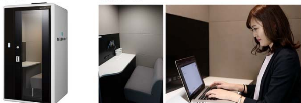
テレキューブ設置イメージ

テレキューブは、テレキューブサービス株式会社 ( https://telecube.jp/ ) (東京都千代田区) が展開している、防音性が高くプライバシーが確保された環境を提供する個室ブース。内部にテーブルと椅子が設置されており、セキュリティが保たれた静かな環境で、資料作成やメールなどの業務、電話・Web 会議などでのコミュニケーションが行える。駅構内に設置することで、西武線利用者や沿線住民にワークスペースを提供する。移動の間の隙間時間を有効活用できるようになり、働き方改革の推進に貢献するとしている。