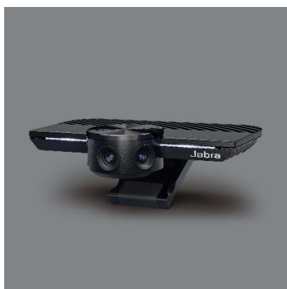
Jabra PanaCast (GN オーディオジャパン)

GN オーディオジャパン株式会社 ( https://www.jabra.jp/ ) (東京都港区)は、ハドルルーム向け、スマートパノラマ4K プラグアンドプレイ会議用ビデオカメラ「Jabra PanaCast(ジャブラパナキャスト)」を9月20日より発売する。マイクロソフト社の「Microsoft Teams」認定製品。