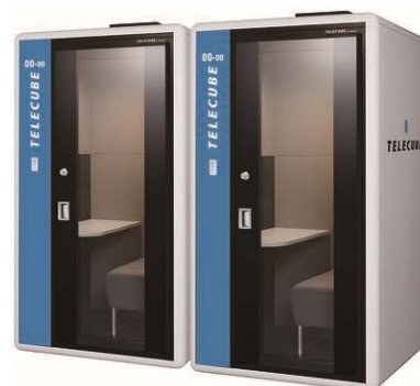
テレキューブ（テレキューブサービス）

テレキューブは、ビジネスパーソンが周囲に気兼ねなく働けるセキュリティの高いコミュニケーションスペースをコンセプトに作られた個室ブース。ICTを活用した場所や時間にとらわれない柔軟な働き方「テレワーク」の浸透に伴い、移動の合間における資料作成や、外出先でのビジネスに関する電話が必要な際に活用できる。