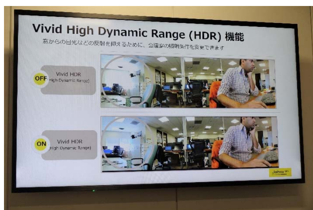
Vivid HDR ON/OFF の違い

その他の Jabra PanaCast の特徴としては、室外からの光線による白くぼやけることで不鮮明になるハレーションを適切なレベルに調整する「Vivid HDR」にも対