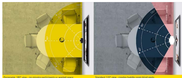
カメラ画角 180度 (左)、120度 (右) の比較

応している。また、Jabra PanaCast が接続されたパソコンから Vivid HDR や画角、LED、マイクなど本体の各種設定が簡単に行えるようになっている。加えて、ファームウェアなど企業のデバイスの一元管理も対応している。