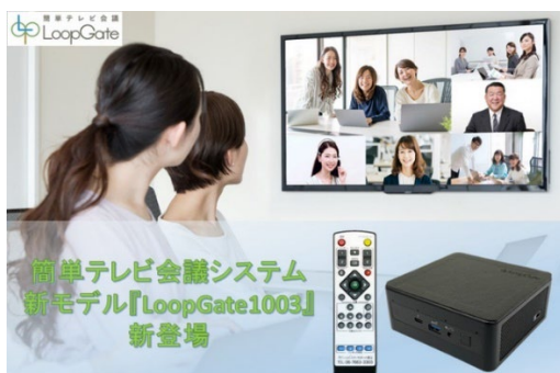
LoopGate1003 発売 (ギンガシステム)

ギンガシステム株式会社 ( https://ginga-sys.jp/ ) (東京都渋谷区) は、より安定したパフォーマンスを実現した簡単テレビ会議システム「LoopGate1003」の販売を開始する。